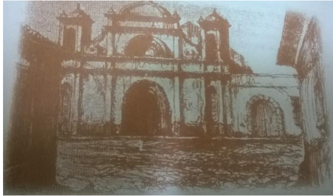
Convento de San Francisco, construido en San Salvador en 1580. Fue sede de la Universidad de El Salvador desde el 16 de febrero de 1841 hasta el 8 de diciembre de 1844.