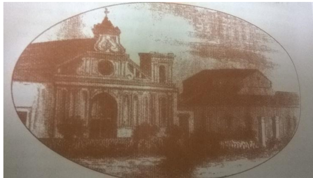
Iglesia y convento Santo Domingo, segunda sede de la Universidad de El Salvador a partir de 1844.

A pesar de haber comenzado sus actividades académicas en 1843, es hasta el año 1880 que la Universidad se subdividió en facultades y por resolución del Poder Ejecutivo se establecieron siete de ellas: ciencias y letras; ingeniería; farmacia y ciencias naturales; medicina y cirugía; ciencias políticas y sociales; jurisprudencia y teología.